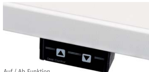
Auf / Ab Funktion